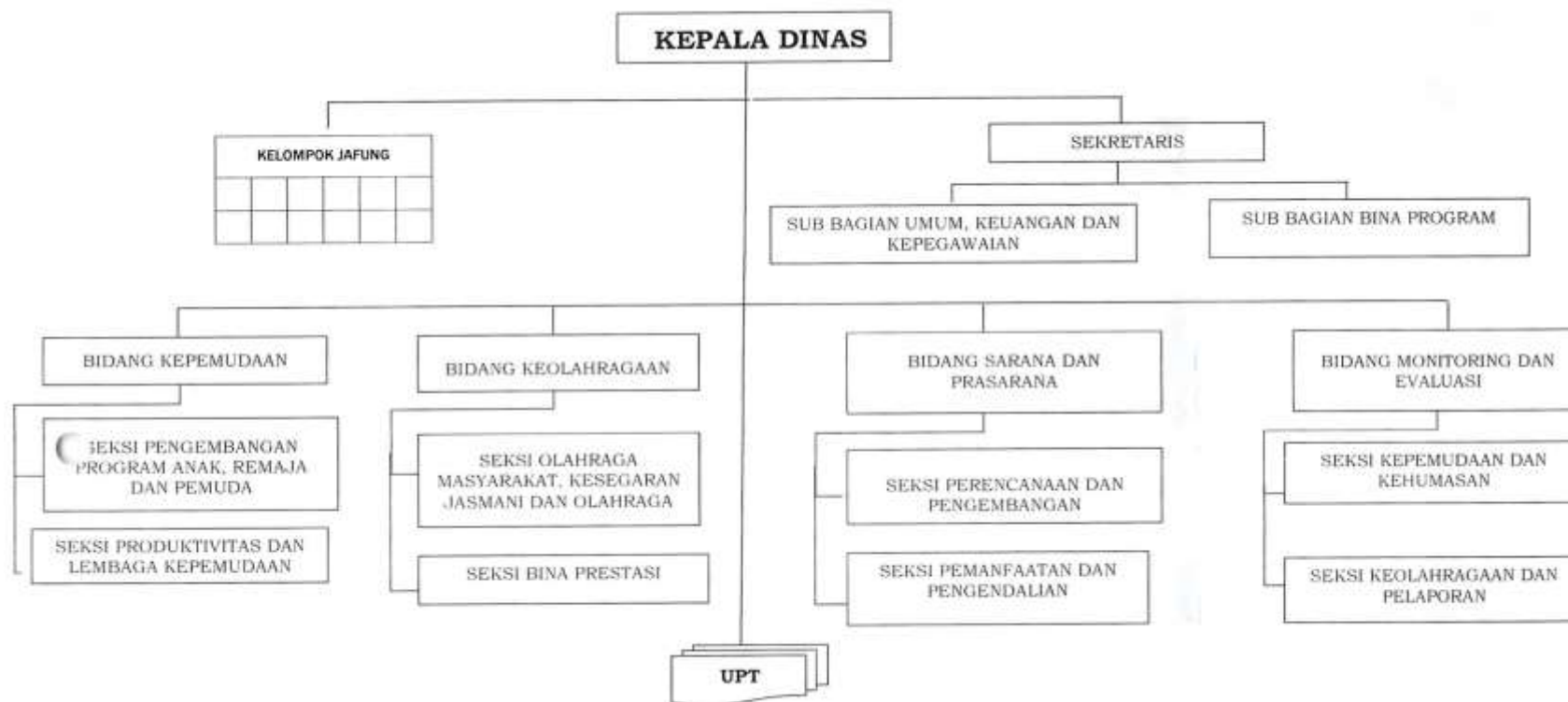
Gambar 2.1. Struktur Organisasi Dinas Kepemudaan dan Olahraga